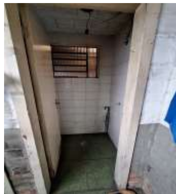
29 Térreo da frente do pavilhão