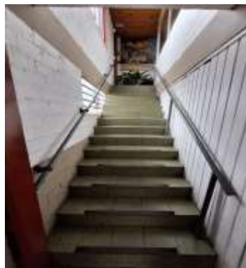
33 Acesso ao mezanino da frente do pavilhão