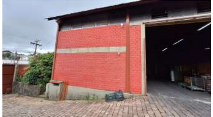
20 Lado oeste do pavilhão dos lotes nº 41 e nº 42