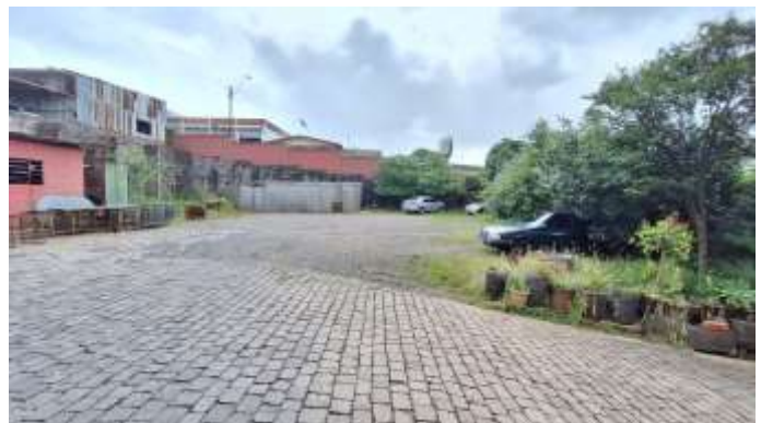
10 Vista interna dos lotes nº 40 e nº 39 (ao fundo)