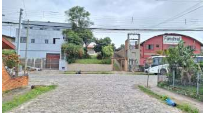
2 Vista pela Traversa Lagoa Vermelha - avaliandos na direita