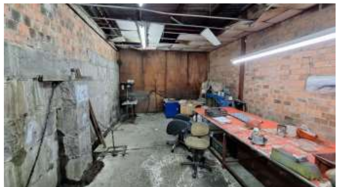
24 Anexo lateral leste do pavilhão