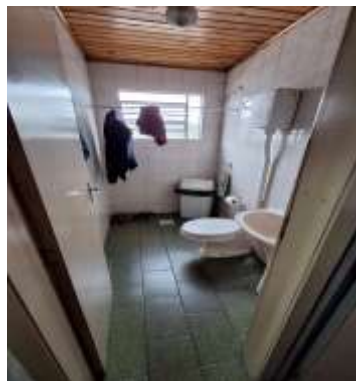
34 Mezanino da frente do pavilhão