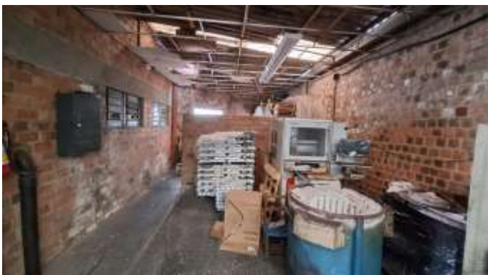
23 Anexo lateral leste do pavilhão