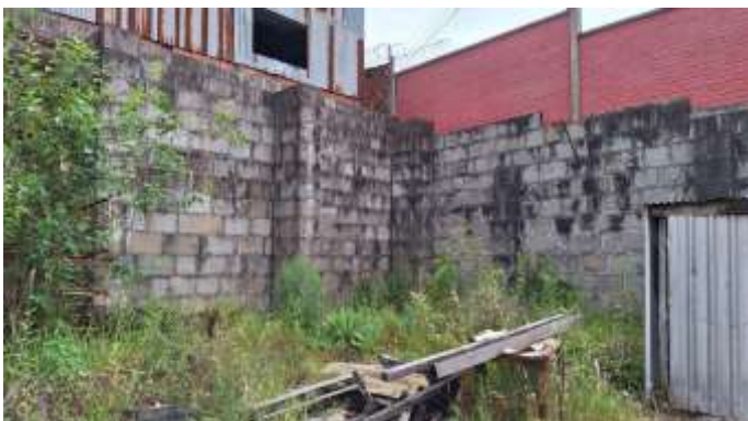
11 Quadrante sudoeste do lote nº 39