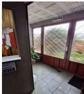
27 Térreo da frente do pavilhão