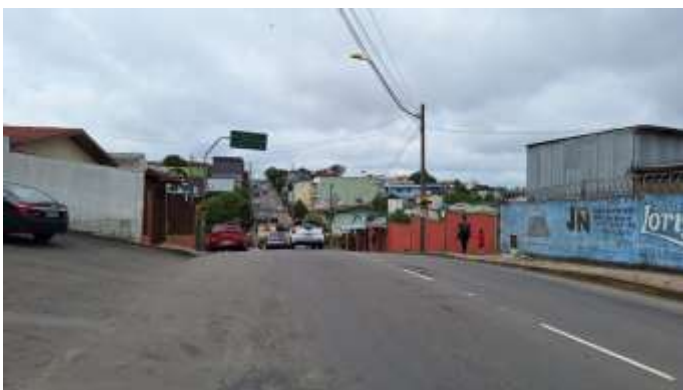
5 Traversa São Marcos - avaliandos na esquerda