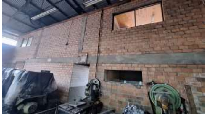
26 Frente do pavilhão em dois pavimentos