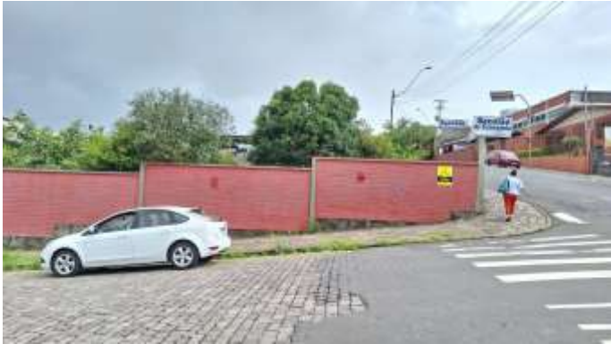
7 Frente norte do lote nº 39