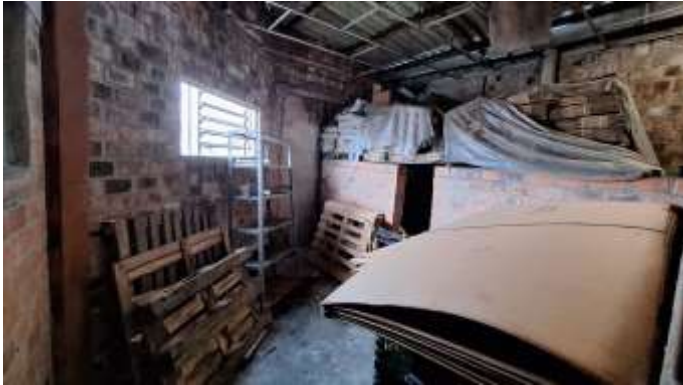
25 Anexo lateral leste do pavilhão