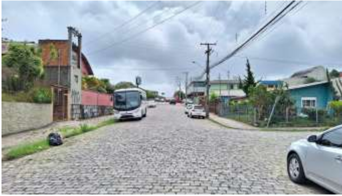
1 Rua São Francisco de Paula - avaliandos na esquerda