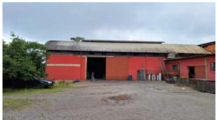
18 Pavilhão sobre os lotes nº 41 e nº 42 visto do lote nº 39