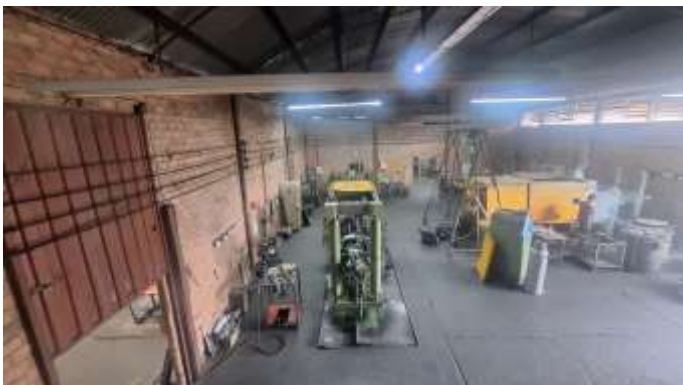
21 Vista interna do pavilhão dos lotes nº 41 e nº 42