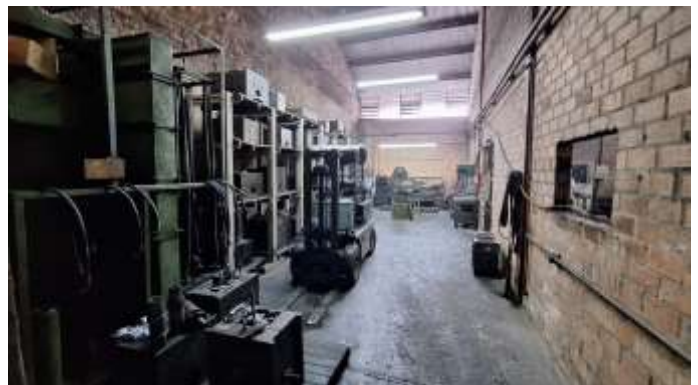
22 Fundos do pavilhão dos lotes nº 41 e nº 42