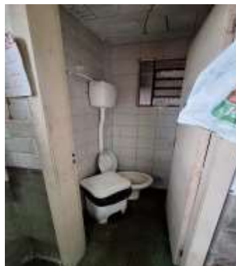
30 Térreo da frente do pavilhão