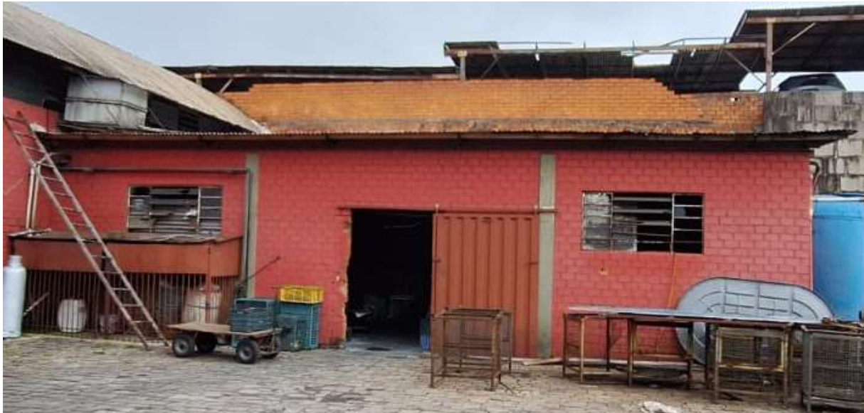
Figura 1 – Pavilhão simples no lote nº 40