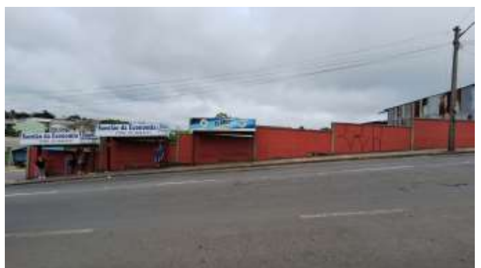
6 Frente oeste do lote nº 39