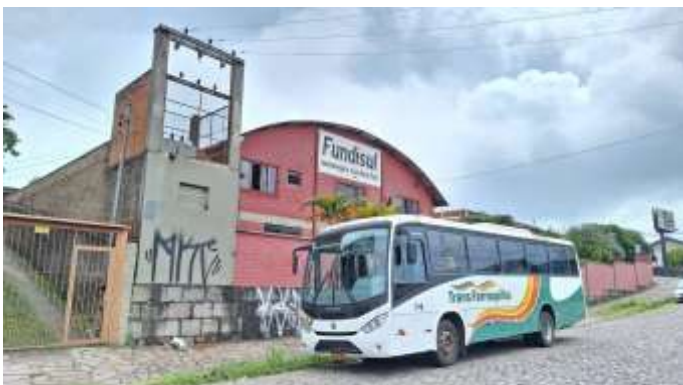
17 Pavilhão sobre os lotes nº 41 e nº 42