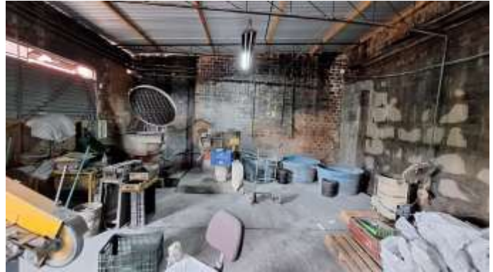
14 Vista interna do pavilhão simples do lote nº 40