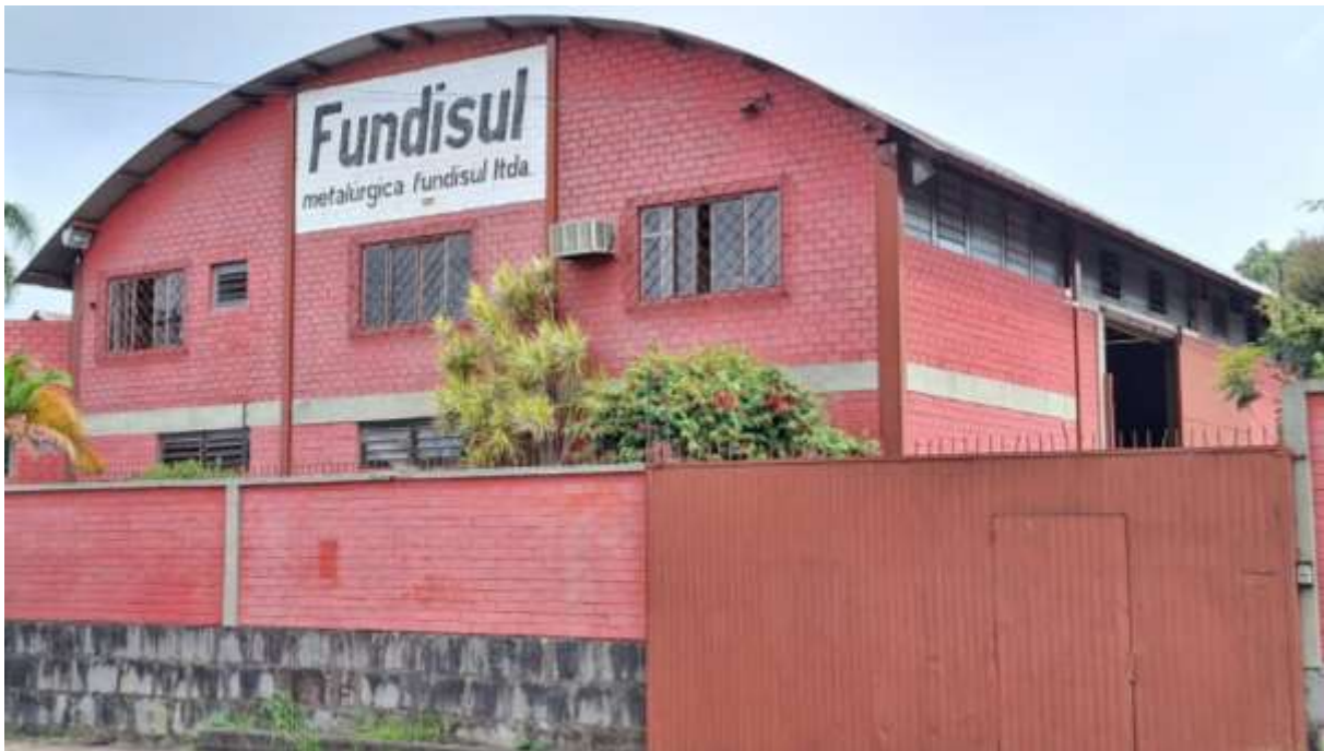
Figura 2 – Pavilhão sobre os lotes nº 41 e nº 42

Conforme indicado no item anterior este lote forma conjunto com o lote nº 41 e nesta condição será avaliado.