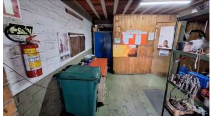
32 Térreo da frente do pavilhão