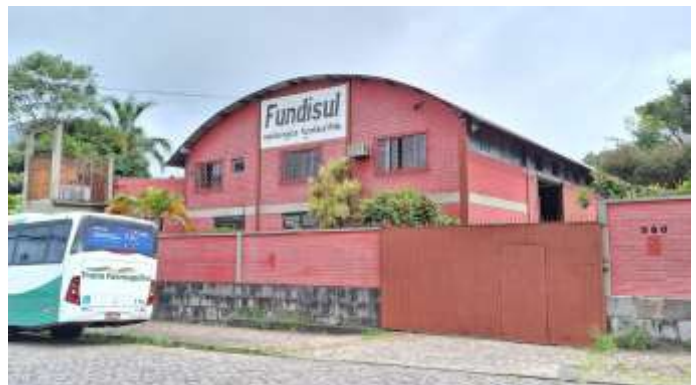
16 Pavilhão sobre os lotes nº 41 e nº 42