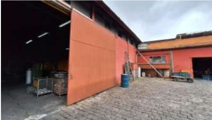
19 Lado oeste do pavilhão dos lotes nº 41 e nº 42