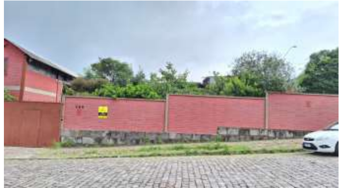
8 Frente norte do lote nº 40