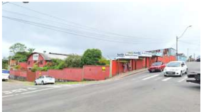
4 Rua São Francisco de Paula com Traversa São Marcos