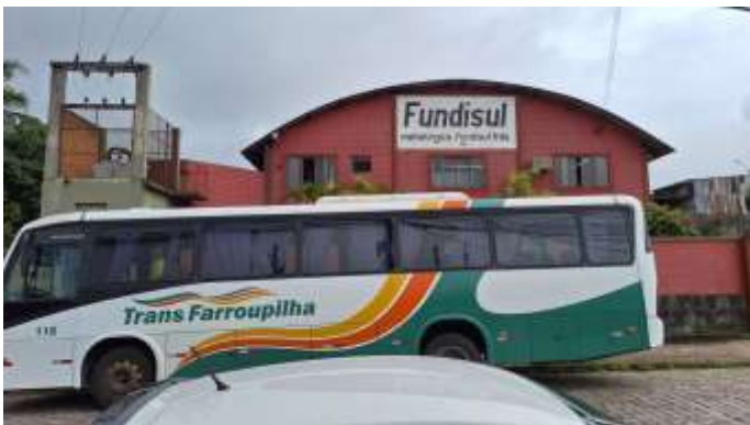
9 Frente norte dos lotes nº 41 e nº 42