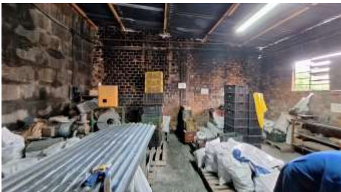
15 Vista interna do pavilhão simples do lote nº 40