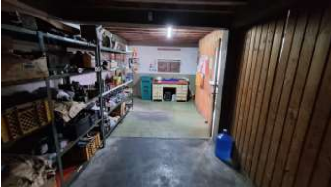
31 Térreo da frente do pavilhão