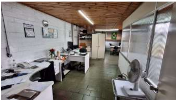
35 Mezanino da frente do pavilhão