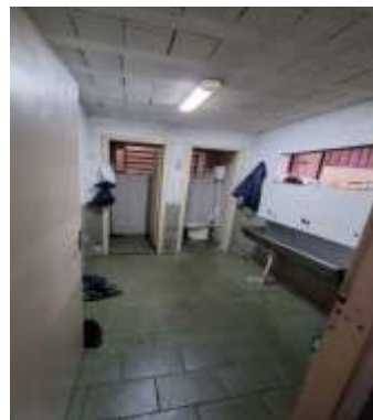
28 Térreo da frente do pavilhão