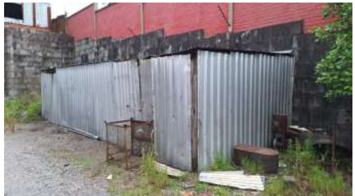
12 Galpão SEM VALOR COMERCIAL no lote nº 39