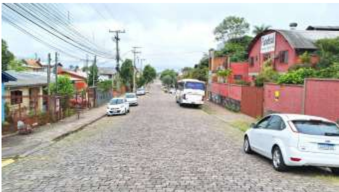
3 Rua São Francisco de Paula - avaliandos na direita