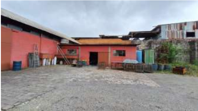
13 Pavilhão simples no fundo do lote nº 40